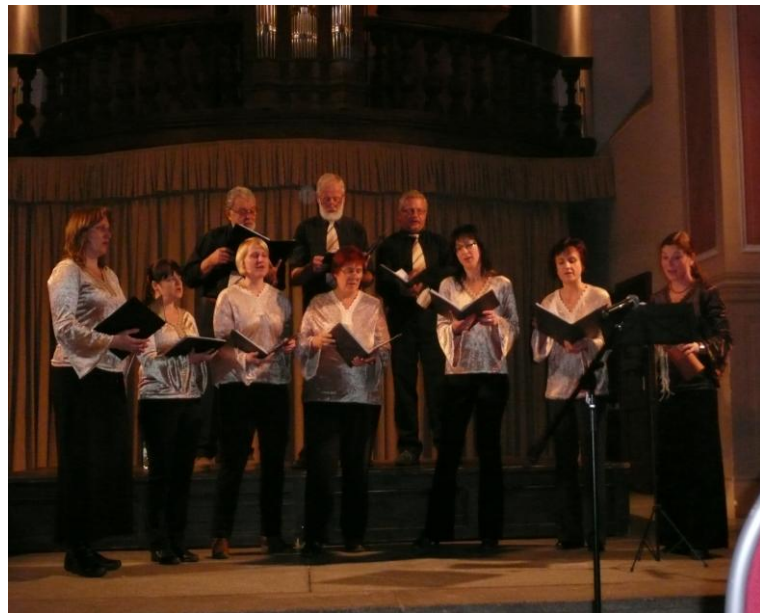
Sbor Rosa coeli